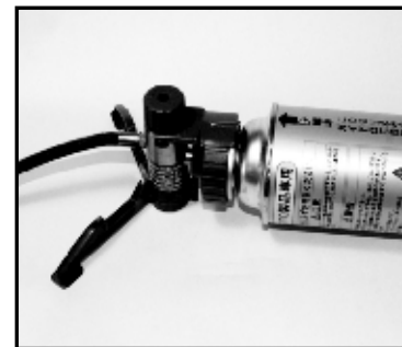
⑥容器(ボンベ)取り付け完了です。