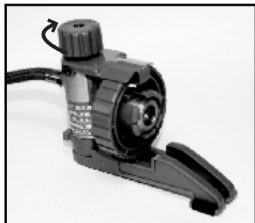
①器具栓つまみが閉じていることを確認します。