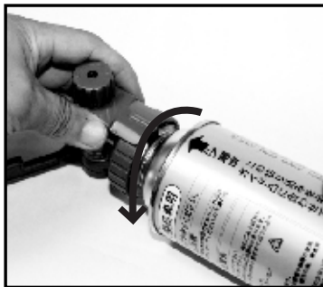
⑤ボンベホルダーを左方向へ止まるまでしっかりと回し容器(ボンベ)を固定します。