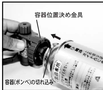
④容器(ボンベ)の切れ込み部に容器位置決め金具が入るように容器(ボンベ)をボンベホルダーの三つ爪に押し込みます。