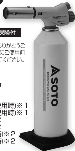
転倒防止 スタビライザー付き