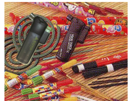
花火、線香の着火に